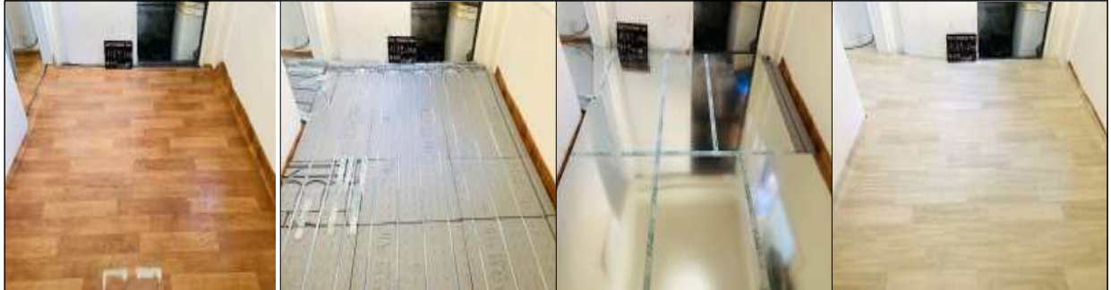
<장판제거 → 바닥판넬 설치 → 보일러 연결 → 장판 마무리>

* 보일러 배관(가스, 수도), 전기, 분배기 등 제반사항이 충족되어 있지 않은 경우 지원 불가