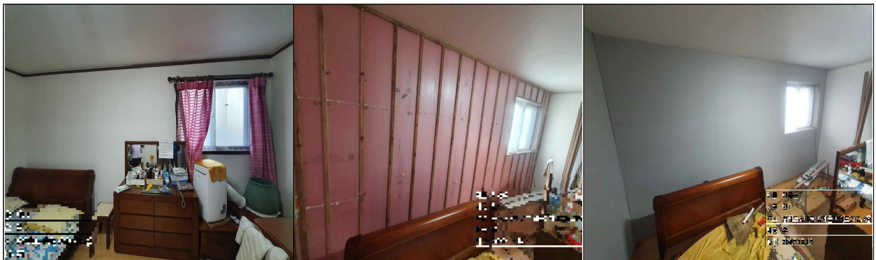
<벽면 단열재 부착 → 목구조 시공 → 석고보드 → 도배 마무리>

* 단열 시공 시 벽체가 5~7cm 나오게 되어 방 공간이 경미하게 축소