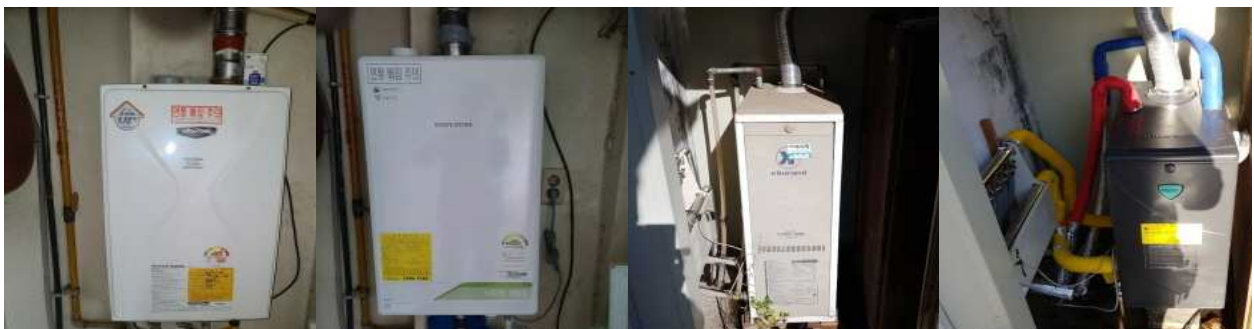
<기존 보일러 확인 → 보일러 철거 → 보일러 교체 설치>

※ 배관(가스, 수도, 난방), 전기, 분배기, 부식 등 제반사항이 충족되어 있지 않은 경우 지원 불가