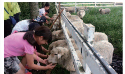
2014. 8. 30 (토) 8월 현장체험 (하이드스토리 교육농장)