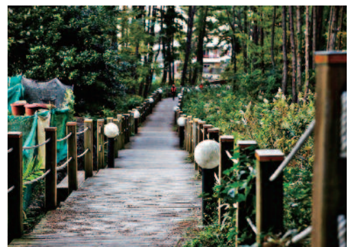
제주의 중심! 글로벌 명품 연동