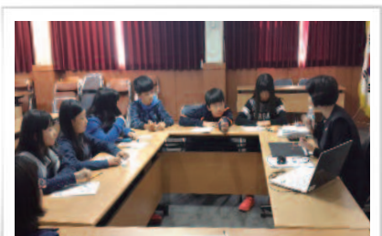
2014. 10. 25 (토) 제1차 어린이 생활법률교실 운영