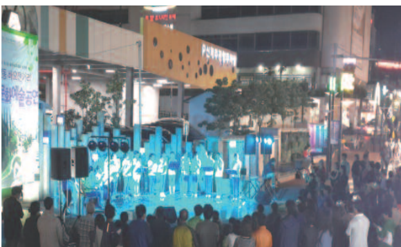
2014. 10. 5 연동 바오젠거리 문화예술공연 개최