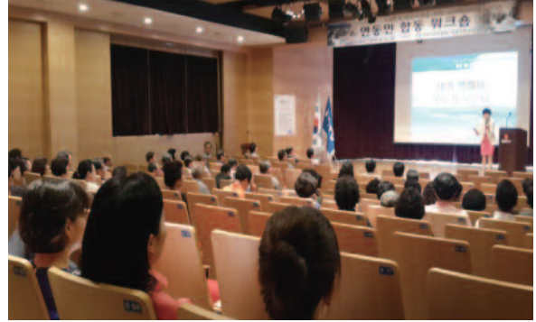
2014. 8. 12 지역현안문제 해결방안 및 글로벌 명품 연동만들기 합동 워크숍