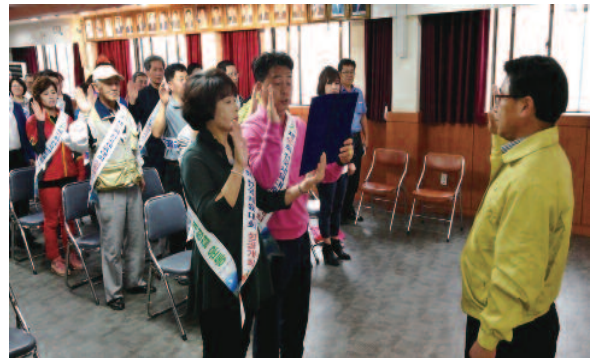
2014. 9. 19 전국체전의 성공적 개최를 위한 범시민 대청결운동 발대식 개최