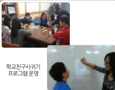
학교친구사귀기 프로그램 운영