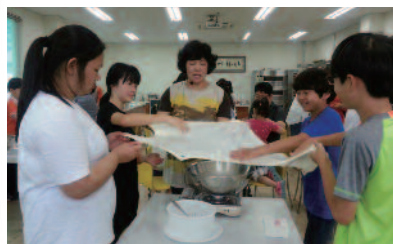
2014. 6. 21(토) 6월 현장체험 (아침미소 농원목장)