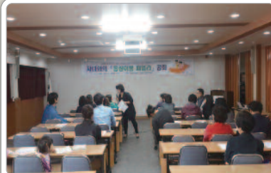
2014. 5. 10 자녀와의 동상이몽 패밀리 강좌 운영