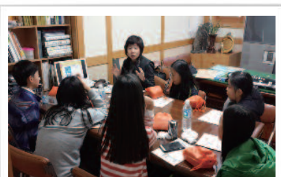
2014. 11. 15(토) 제2차 어린이 생활법률교실 운영