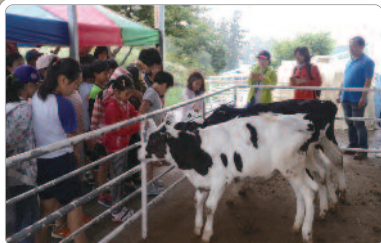
2014. 6. 21 아침미소 농원목장 체험