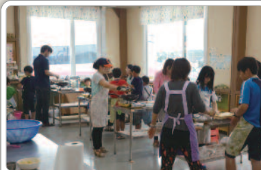
2014. 7. 26 초록꿈 농장체험 교실 운영