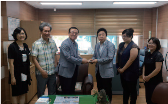
2014. 9. 5 신제주초등학교 어려운 초등학생들을 위해 성금 전달