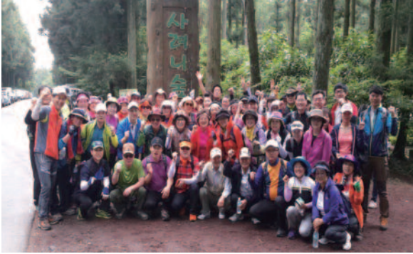
2014. 6. 7 연동민 화합 한마음 올레코스 걷기 대회