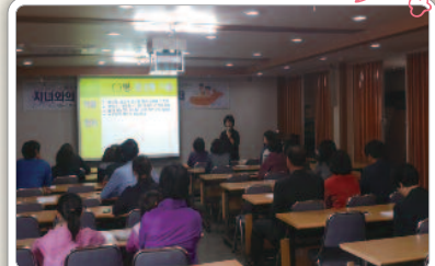
2014. 5. 10 학부모 대상의 자녀와의 "동상이몽 패밀리" 강좌