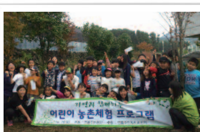
2014. 10. 26(일) 10월 현장체험 (한라생태체험학교)