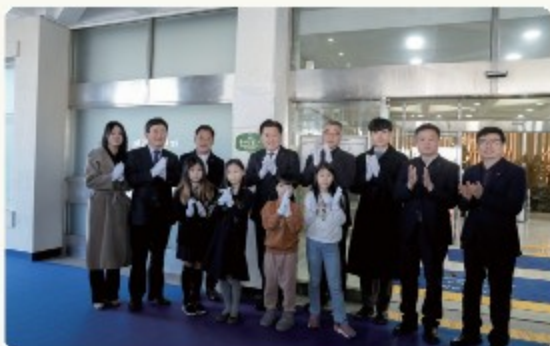
- 환경교육도시 현판식('23.12.27.)