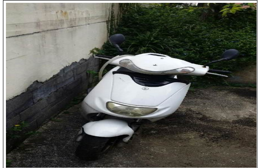
무단방치 이륜차 (전면)