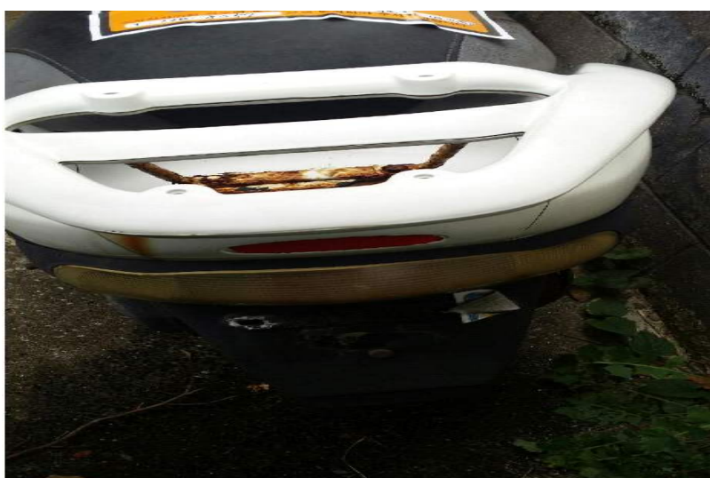
무단방치 이론차 (후면)