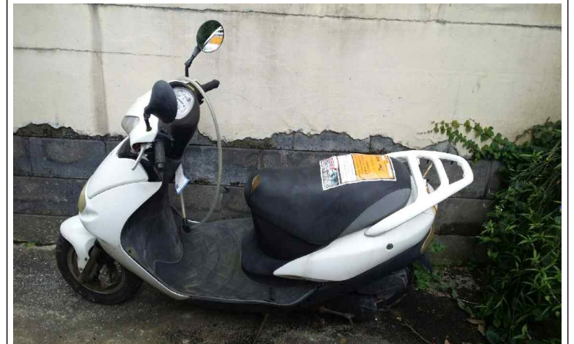
무단방치 이륜차 (측면)