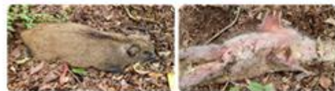
〈전형적인 증상 : 피부가 붉은색으로 변함〉

※ 산행중 부패한 냄새가 심하게 나면 주변에 폐사체가 있을 가능성이 높음