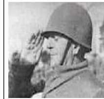
타흐신 야즈즈 육군 준장 (1892. ~ 1971.2.11.) 상훈 : 미국 은성무공훈장