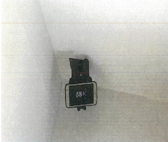
모바일 CCTV 집안에 설치된 모습(예) (현관부근에 설치 함)