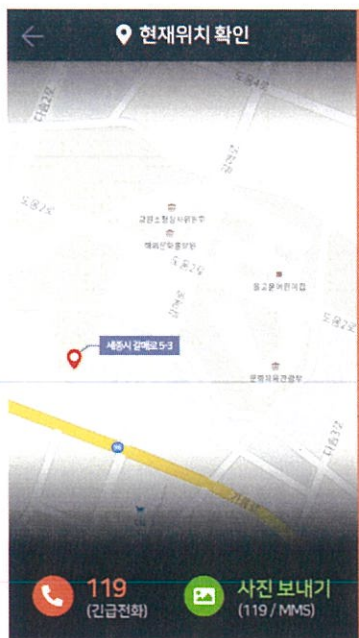
발달장애인 실종시 위치 확인 화면 (발달장애인 소지 GPS용 스마트폰)