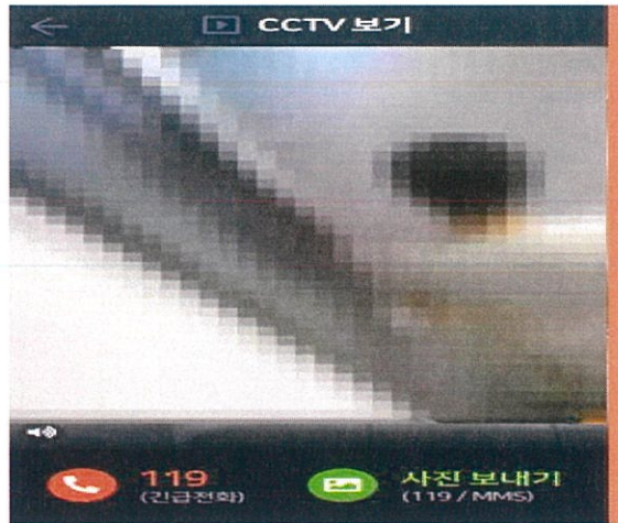
부모님(보호자) 스마트폰에 보이는 모습