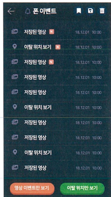
발달장애인이 무단 외출시 발생하는 이벤트 영상 보기 화면(부모님 보유 스마트폰)