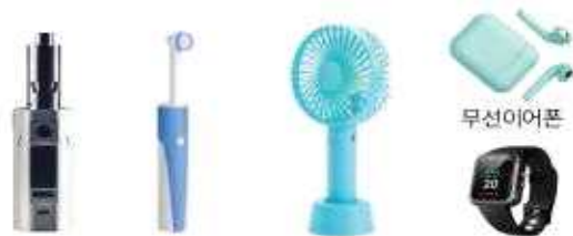
전자담배 무선전동칫솔 (일체형)손전풍기 스마트워치

※ 폐건전지 전용 수거함에 배출이 불가능할 경우 (사)한국전자재활용협회 문의 후, 주민센터·선별장 등을 통해 배출