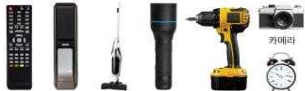
리모콘 도어락 무선청소기 손전등 무선전동공구 카메라 시계

※ 제품에 내장된 건전지 중 탈착이 가능한 건전지(배터리)는 분리하여 폐건전지 전용수거함에 배출