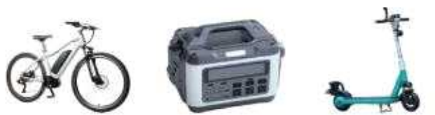
전기자전거(배터리) 파워뱅크 전동킥보드(배터리)

※ 폐건전지 전용 수거함에 배출이 불가능할 경우 (사)한국전자재활용협회 문의 후, 주민센터·선별장 등을 통해 배출