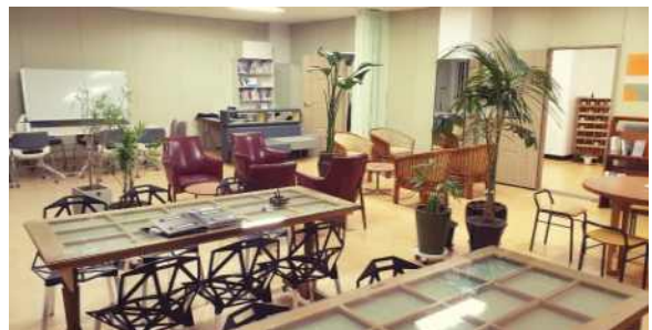
▲ 소통협력센터 임시사무실 내 공유라운지